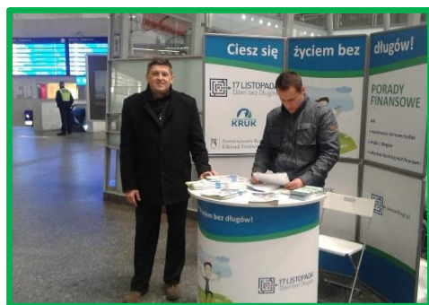
Zdjęcie: Dzień bez długu - Warszawa 2014 r.