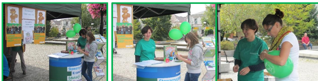
Zdjęcia: Stoisko SKEF podczas pikniku „Makulatura na drzewo” 2014 r.

wziąć udział w konkursach z wiedzy finansowej i wygrać nagrody. Ponadto odwiedzający stoisko SKEF mogli uzyskać materiały poradnikowe na temat edukacji finansowej.