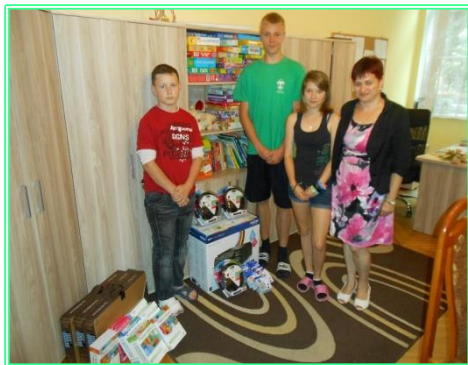
Zdjęcie: Przekazanie podarunków podopiecznym Domu Dziecka w Oławie

W trakcie trwania zbiórki publicznej przeprowadzono jedno otwarcie skarbon , które odbyło się w dniu 11 czerwca 2014 roku. Zebrano kwotę 16.250,36 zł. (słownie złotych: szesnaście tysięcy dwieście pięćdziesiąt 36/100). Wszystkie środki uzyskane podczas zbiórki pochodziły z wystawionych skarbon w oddziałach Kasy Stefczyka. Na utworzony specjalnie na potrzeby zbiórki rachunek bankowy nie wpłynęły żadne środki finansowe. Za uzyskane środki zakupiono: zestawy komputerowe, urządzenia wielofunkcyjne, słuchawki z mikrofonem, zestawy tuszy do urządzeń wielofunkcyjnych, gry multimedialne.