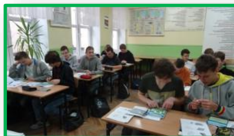
Zdjęcia: Warsztaty z projektu „Twoje osobiste finanse. Warsztaty z planowania finansowego i zarządzania budżetem osobistym dla uczniów szkół ponadgimnazjalnych. II edycja”.