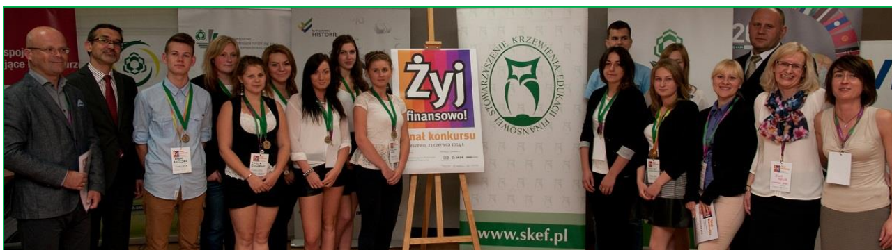
Zdjęcia: Finał konkursu „Żyj finansowo!” Sobieszewo 2014 rok