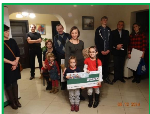
Zdjęcie: Uroczystość zakończenia V edycji projektu „Pomóż oszczędzać rodzinie” – na zdjęciu: rodziny uczestniczące w V edycji -