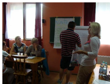
Zdjęcia: Warsztaty Wandzino 2014 rok.

W ciągu roku 2014 pracownicy SKEF prowadzili cykliczne szkolenia dla nowo zatrudnionych pracowników Kasy Stefczyka i Kas z grupy Kas Stefczyka w Ośrodku szkoleniowym SKOK we Władysławowie, przybliżając misję i cele statutowe SKEF. Ponadto, Stowarzyszenie realizowało działalność szkoleniową, także z innymi organizacjami o podobnym profilu działalności. W 2014 roku zespół SKEF na bieżąco prowadził promocję szkoleń. Zostały przesłane oferty szkoleniowe SKEF do Miejskich i Gminnych Ośrodków Pomocy Społecznej, Uniwersytetów III wieku, Klubów Seniora i innych organizacji z którymi SKEF mógłby nawiązać współpracę szkoleniową.