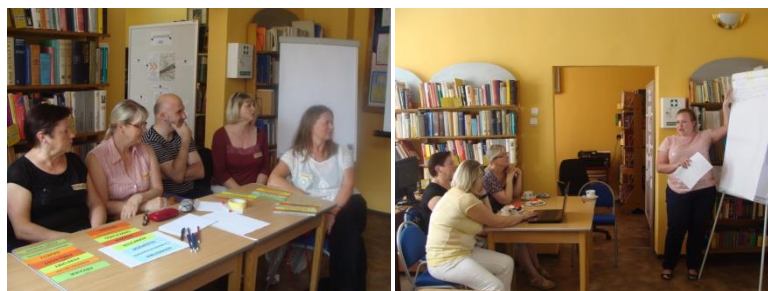
Zdjęcia z warsztatów w Bibliotece w Słomnikach 2014 rok.