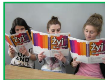
Zdjęcie: Uczestnicy VI edycji Żyj Finansowo ...

Ostatnim elementem projektu było przygotowanie przez uczniów planu finansowego (biznes planu) dla młodej osoby podejmującej studia w innym mieście. Biznes plan zakładał, że sytuacja będzie wymagała sfinansowania części kosztów pożyczką lub kredytem. Praca powyższa mogła wziąć udział w konkursie „Żyj finansowo”. Opiekunowie realizujący projekt z prac napisanych przez uczniów wybrali dwie najlepsze i przesłali do SKEF. Spośród nich zostały wybrane 12 najlepszych które wzięły udział w finale konkursu 19-22 czerwca 2014 w Sobieszewie.