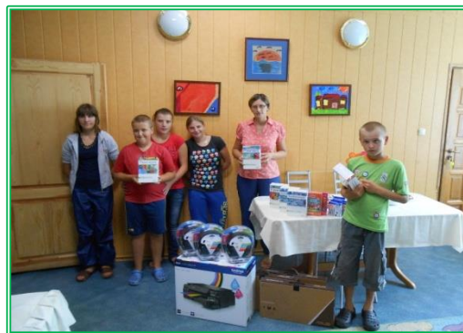
Zdjęcie: Przekazanie podarunków Podopiecznym Centrum Opiekuńczo-Wychowawczego w Golance Dolnej

W 2014 roku wsparte zostały dwa Domy Dziecka - Dom Dziecka w Oławie (pl. Zamkowy 17, 55-200 Oława) i Centrum Opiekuńczo-Wychowawcze Powiatu legnickiego w Golance Dolnej (Golanka Dolna 6, 59-230 Prochowice).