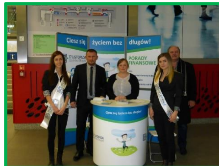
Zdjęcie: Dzień bez długu – Kraków 2014 r.